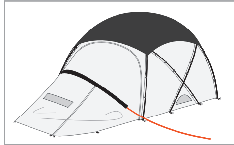
마카돔 베스티블 지주 폴대 1개를 끼워 넣어 주세요.