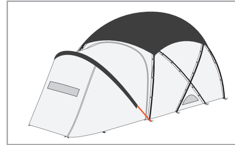
마카돔 베스티블 지주 폴대 1개를 끼워서 체결해 주세요.