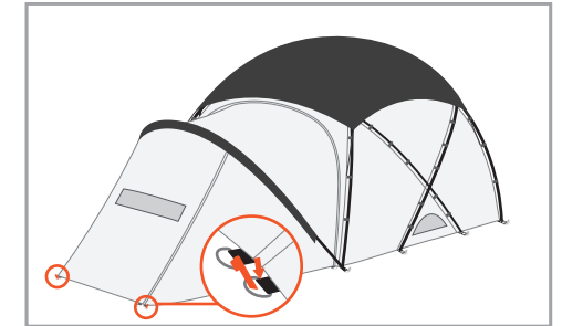
베스티블 앞쪽 두곳 최대한 당겨서 팍다운 해주세요. (팍다운 링과 출입문 링을 잘 구분해서 팍다운 해주세요.)